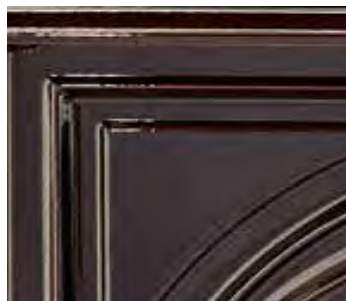
Majolica brown emalj